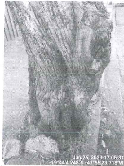
Figura 1 – Árvore morta. Fonte: SEMAM, 2023.